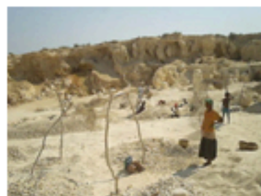
"Raketa mena" évoque la famine causée par la sécheresse dans le Sud.

Un fléau causé essentiellement par la sécheresse qui menace chaque année la population depuis des décennies, voire des siècles. Pour rester en vie, la population doit recourir au fameux raketa mena, le cactus rouge, la seule plante comestible du désert, en attendant les soutiens de l'Etat et de l'étranger qui tardent à venir. Une situation jugée injuste par le réalisateur. L'œuvre a été peu diffusée. La seule avant-première date de février au Cercle germano-malgache avec une assistance strictement sélectionnée. A cette occasion, Raketa mena avait suscité des critiques. Si certains qualifient le documentaire d'"œuvre à frisson", d'autres estiment le propos "insuffisant" pour relater toute la misère du Sud. Effectivement, ce n'en est qu'un échantillon.